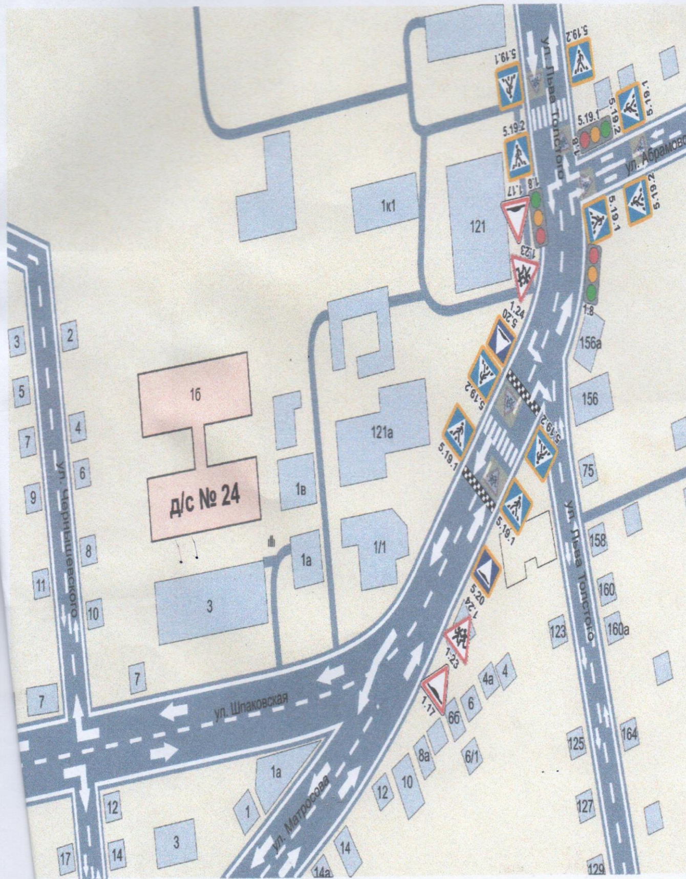
Схема организации дорожного движения в непосредственной близости от МБДОУ №24 «Солнышко» с размещением технических средств, маршруты движения детей, расположения парковочных мест